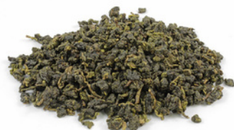
Jin Xuan Nai Xiang