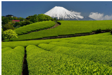
Čajová plantáž v Japonsku