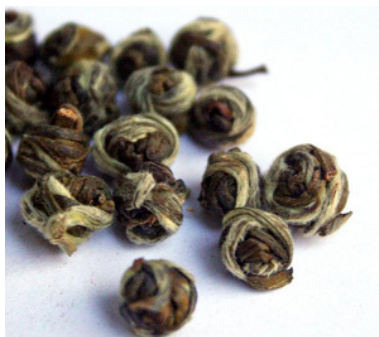
Tian Mu Long Zhu Cha