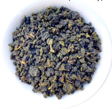
Formosa Ren Shen