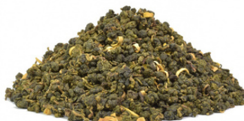
Orange Flower Oolong