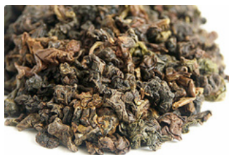
Formosa GABA Oolong