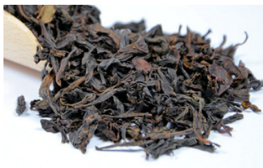
Da Hong Pao