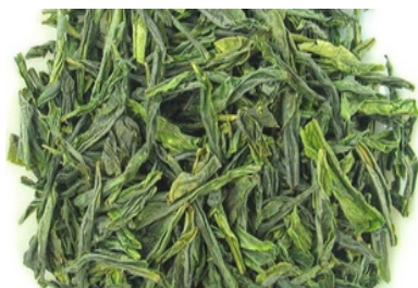
Lu An Gua Pian