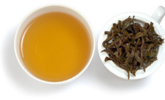
Mi Lan Xiang Dan Cong