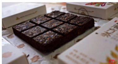
Meng Hai Fang Cha